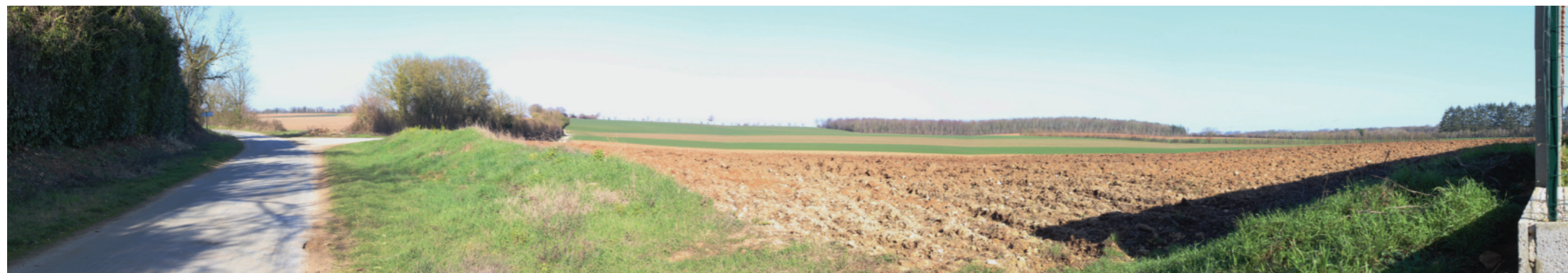
Vue panoramique de l'état initial (angle de vue 120°)