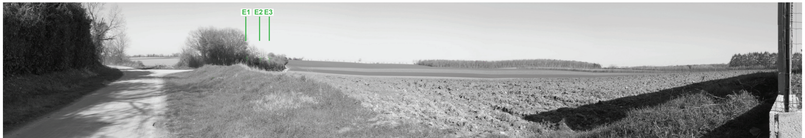
Vue panoramique noir et blanc avec esquisse du projet (angle de vue 120°)

Coordonnées Lambert II étendu : 410187 / 2131219 Date et heure de la prise de vue : 14/02/2019 à 16:48 Focale : 52 mm, équivalent 24 x 36 Azimut vue réaliste : 23° Angle visuel du parc : 3,4° Eolienne la plus proche : E3, à 9 700 m